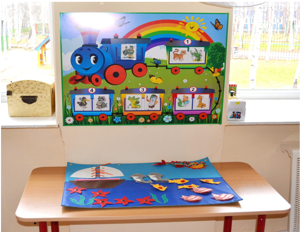
Зона индивидуальной коррекции речи.